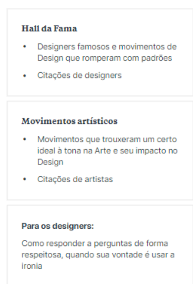
Figura 5 – Conteúdos Adicionais