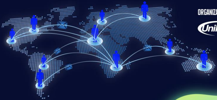
Figura 4 – Capítulo 3: Mensagem dos Especialistas